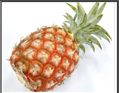
サントルチェパン 沖縄