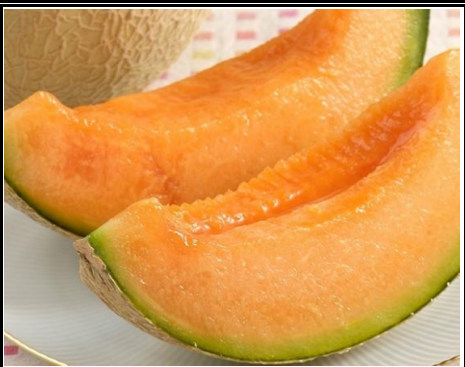
夕張メロン 北海道