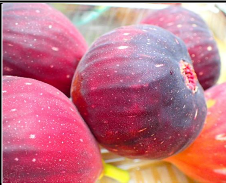
いちじく 愛知 他