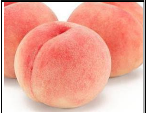
桃(白鳳系) 山梨 他