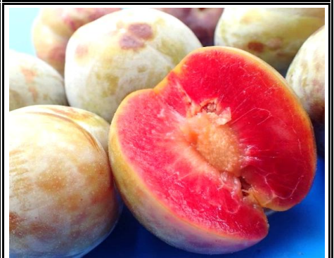
ソルダム 山梨 他