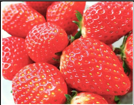
オランダ産 いちご オランダ