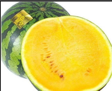
金色羅皇 千葉 他