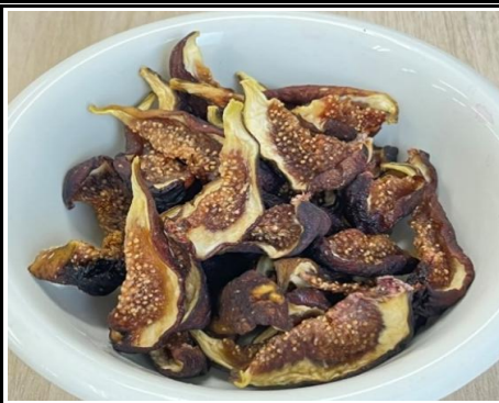
ドライフルーツ いちじく