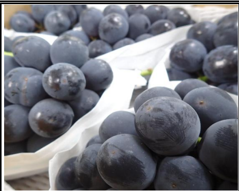
ナガイパール 長野