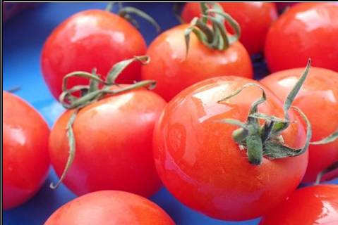
ミニトマト 優糖星 和歌山