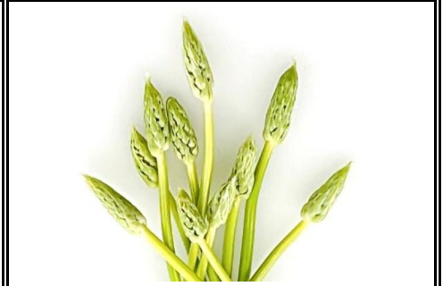
アスパラ ソバージュ 山形