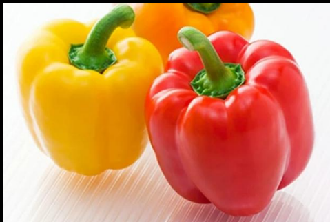
ドルチェパプリカ 愛知 他