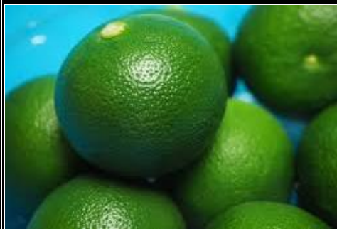
新すだち 徳島 他