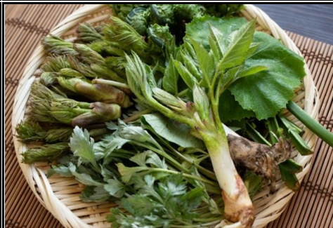
秋田の 天然山菜 秋田