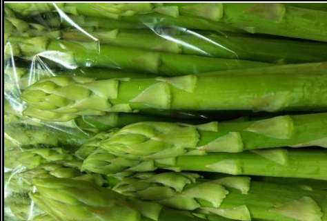
厚木のグリーン アスパラガス 神奈川