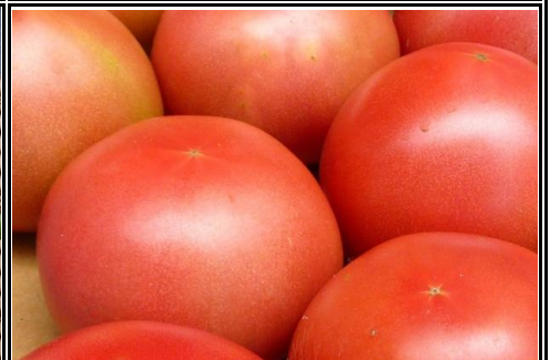
富丸ムーチョ 千葉 他