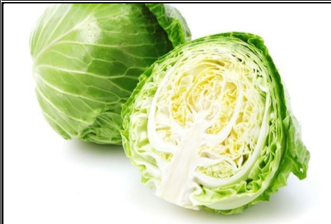
本春キャベツ 神奈川 他