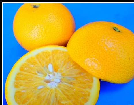
八期 和歌山 他