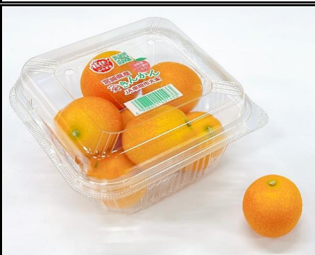
金柑たまたま 宮崎