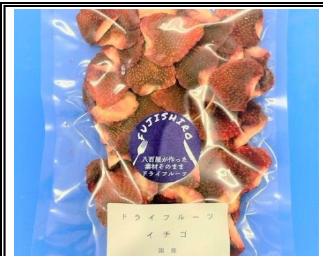
八百屋が作った素材そのままドライフルーツ いちご