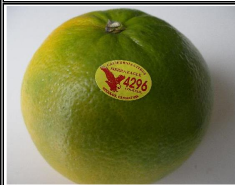
カクテルフルーツ アメリカ