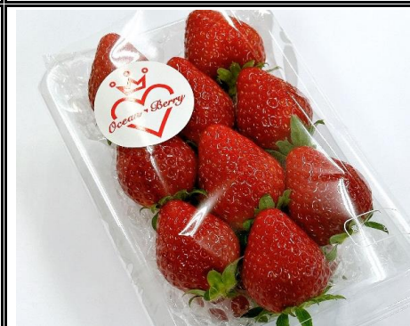
オーシャンベリー 神奈川