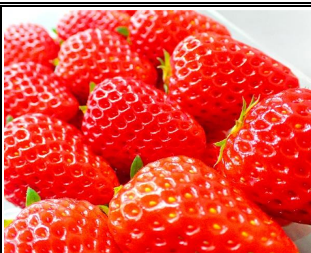
かなこまち 神奈川