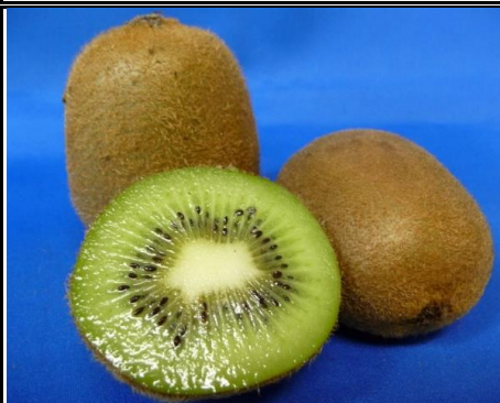
国産キウイ 愛媛 他