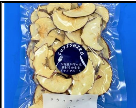
八百屋が作った素材そのままドライフルーツ