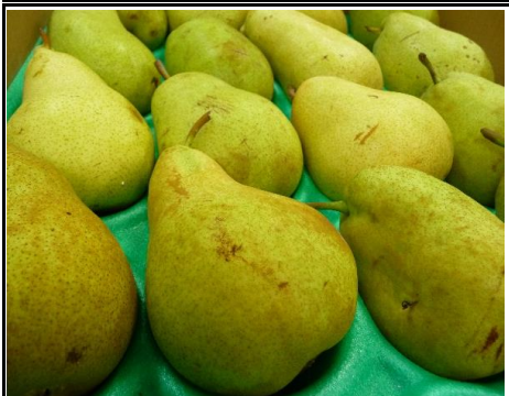
洋梨 山形 他