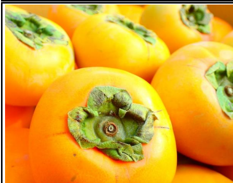
柿 奈良 他