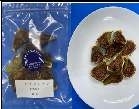
八百屋が作った素材そのままドライフルーツ いちじく