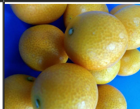
金柑 宮崎 他