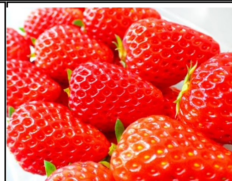
国産苺 栃木 他