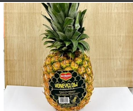
ハニーグロウ フィリピン