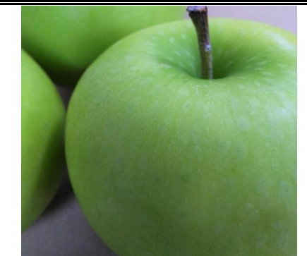
グラニースミス 長野 他