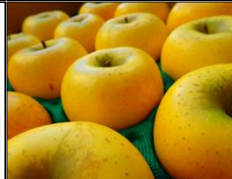
シナノゴールド 長野 他