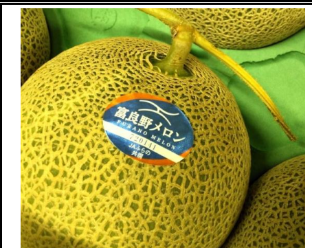
富良野メロン 北海道