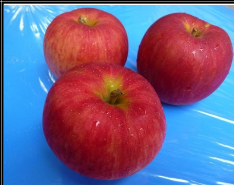
新りんご 長野 他