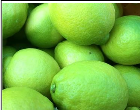
国産 グリーンレモン 愛媛 他