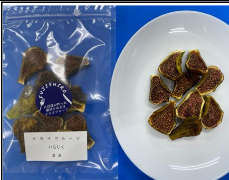
八百屋が作った素材そのままドライフルーツ いちじく