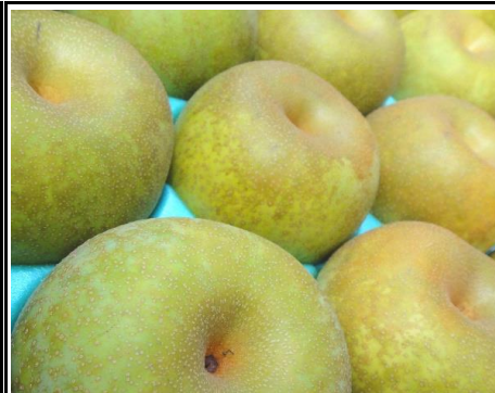
梨 埼玉 他