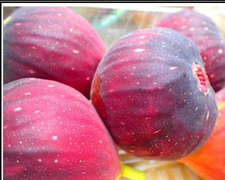
いちじく 神奈川 他