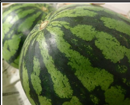
尾花沢すいか 山形