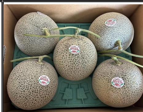
赤肉らいでん 北海道