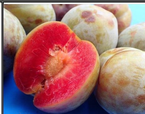
ソルダム 山梨 他