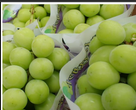
シャイン マスカット 山梨 他