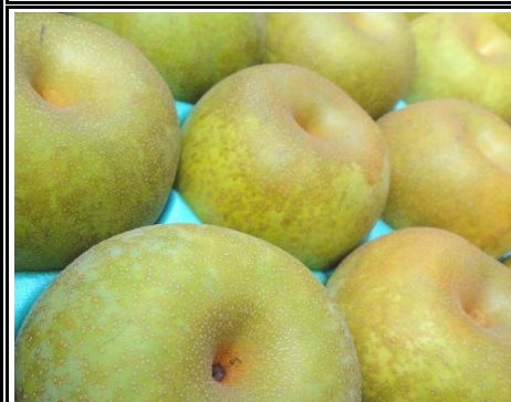
梨 埼玉 他