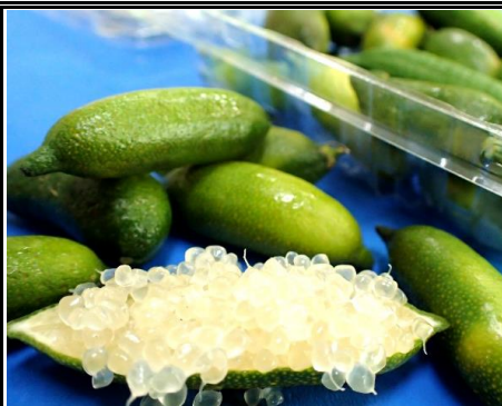
フィンガー ライム 鹿児島 他