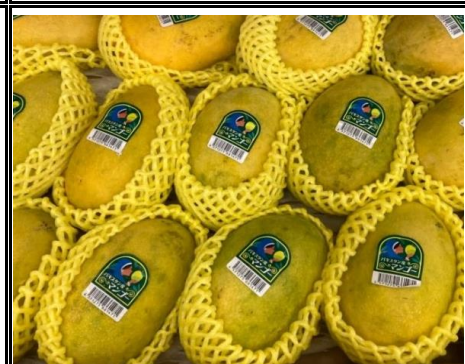
パキスタン マンゴー パキスタン