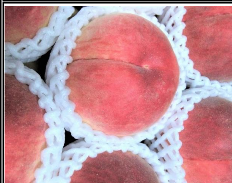
桃 福島 他