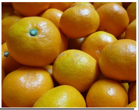
ニュージーランド産温州みかん ニュージ ランド