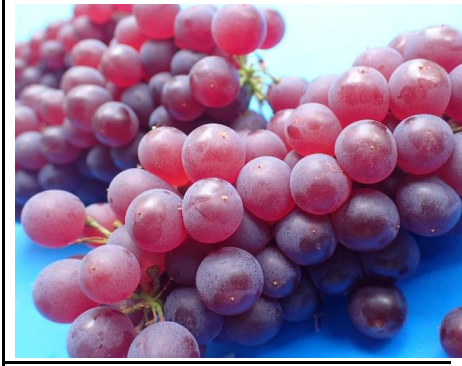
デラウェア 山形 他