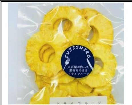
八百屋が作った素材そのままドライフルーツ パイン