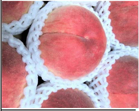
桃 山梨 他