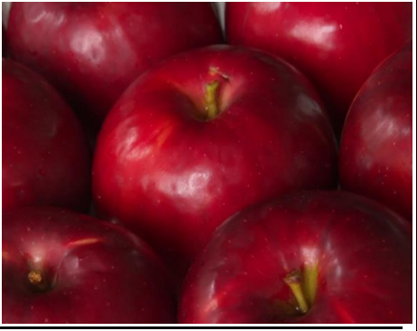
ロイヤルガラ (りんご) ニュージ ランド