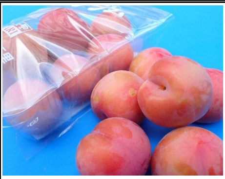
プラム 山梨 他