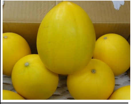
キンショウメロン 茨城 他