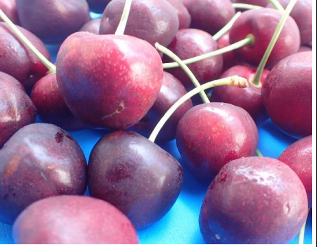
アメリカンチェリー アメリカ