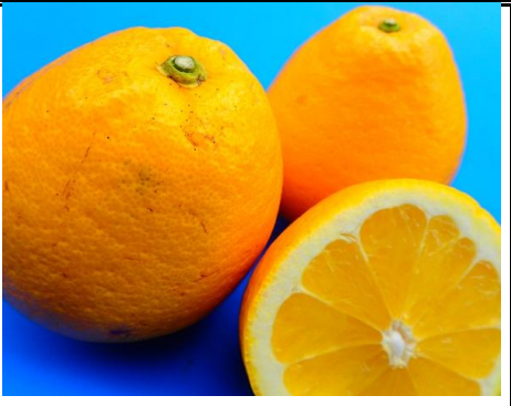
河内晩柑 (宇和ゴールド) 愛媛 他