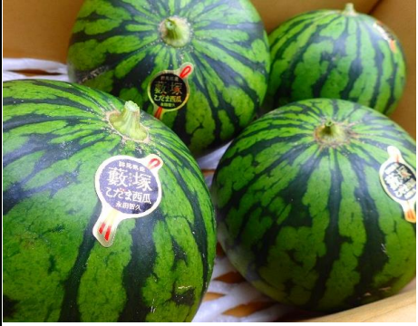
小玉スイカ 群馬 他