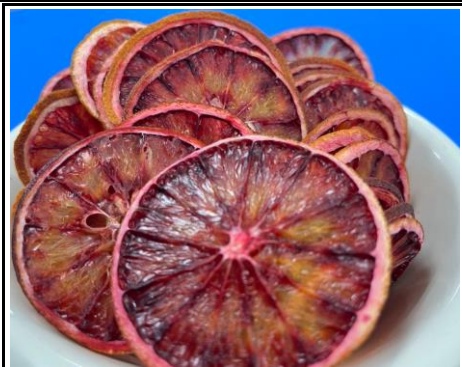
八百屋が作った素材そのままドライフルーツ ブラッドオレンジ