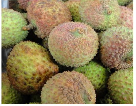
ライチ 台湾 他