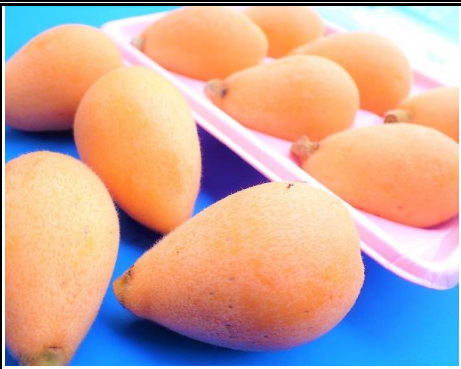
びわ 長崎 他