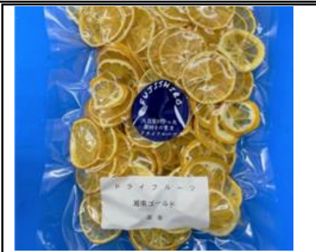
八百屋が作った素材そのままドライフルーツ 湘南ゴールド