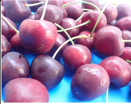
アメリカン チェリー アメリカ