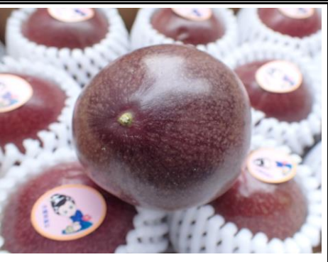
パッション フルーツ 鹿児島