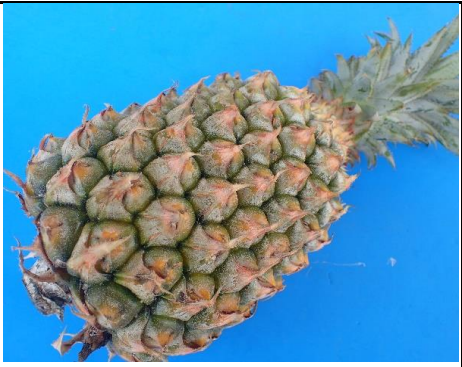
国産パイナップル 沖縄