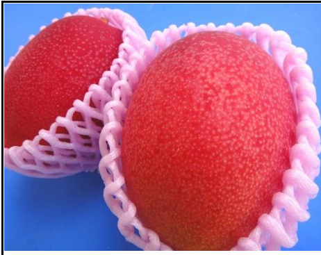
国産マンゴー 宮崎 他