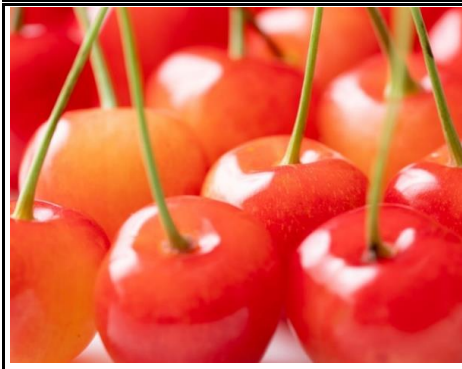
さくらんぼ 山形 他