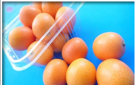
金柑 宮崎 他