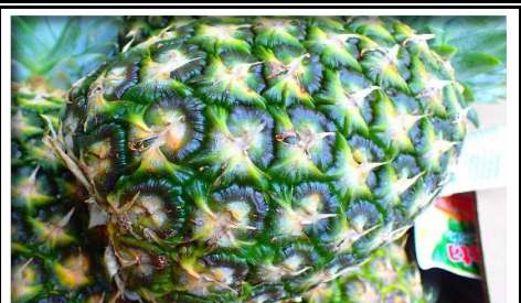
パイナップル フィリピン