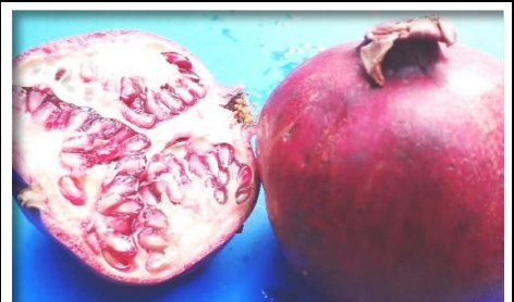
ざくろ アメリカ 他