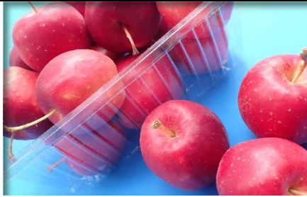
姫りんご・りんご 青森 他