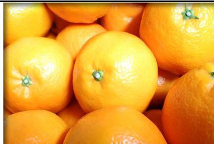
みかん 愛媛 他