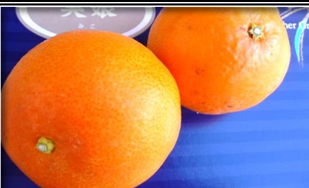
天草 (美娘) 大分