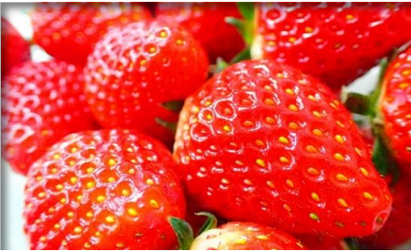
いちご 栃木 他