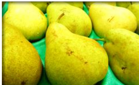
洋梨 山形 他