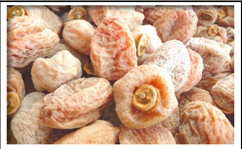
干柿 長野 他