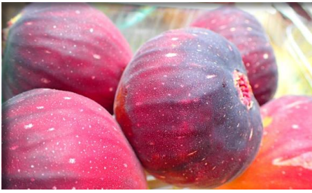
いちじく 愛知・和歌山他