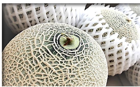
メロン各種 静岡・北海道他