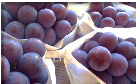
巨峰・ピオーネ 山梨他