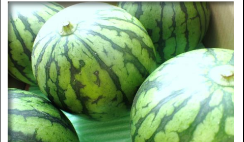
スイカ (小玉・大玉) 鳥取・長野・千葉他