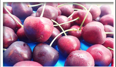
アメリカンチェリー アメリカ