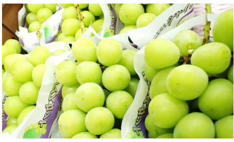
シャインマスカット アレキサンドリア 山梨・岡山他