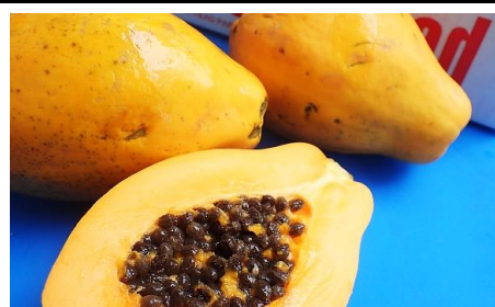
パパイヤ アメリカ他