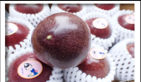
パッションフルーツ 鹿児島