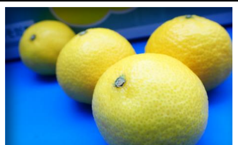
湘南ゴールド 神奈川