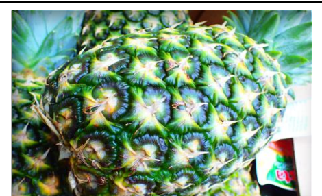
パイナップル フィリピン