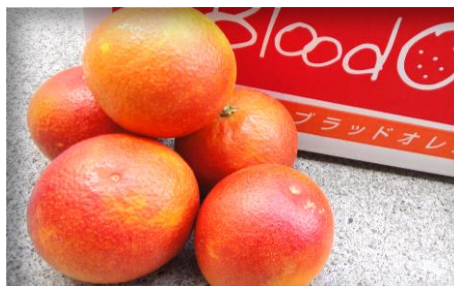
ブラッドオレンジ 愛媛 他