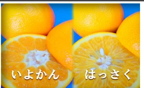
いよかん はっさく