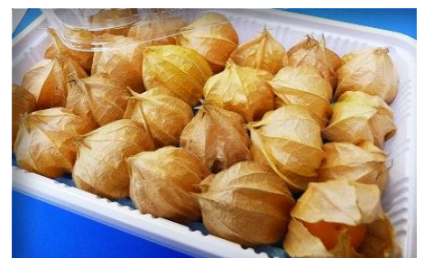
食用ほおずき 愛知