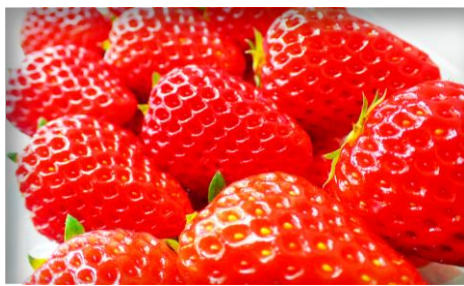
いちご 栃木他各産地