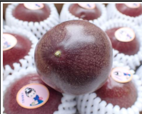
パッション フルーツ 鹿児島