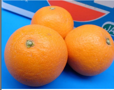
清見 愛媛 和歌山 他