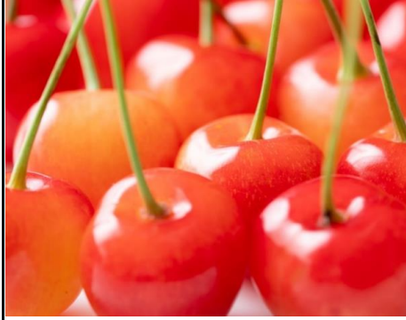
さくらんぼ 山形 他