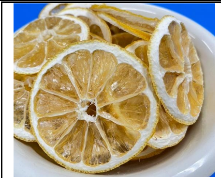
八百屋が作った素材そのままドライフルーツ 日向夏