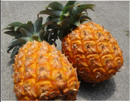
ピーチパイン 沖縄