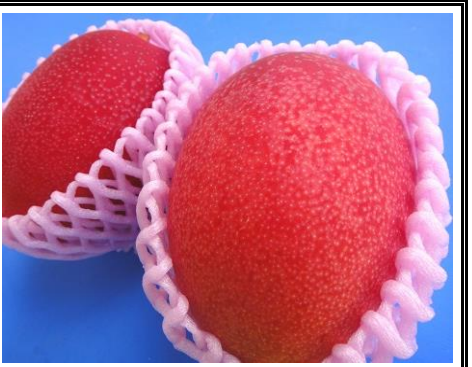
国産マンゴー 宮崎 他