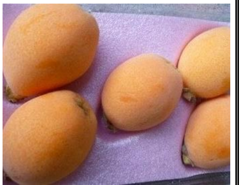
びわ 長崎 他