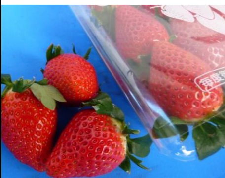
やよいひめ 群馬 他