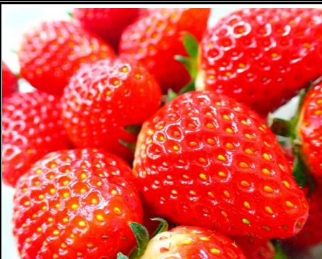
国産苺 栃木 他