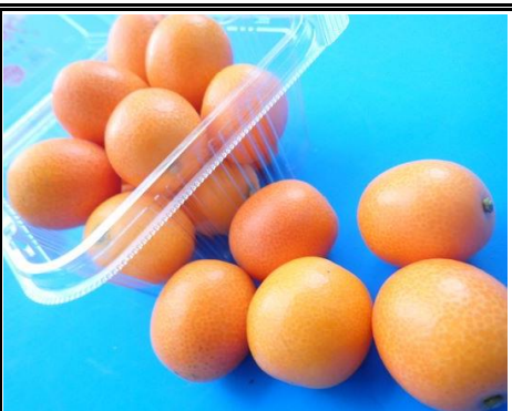
金柑 宮崎 他