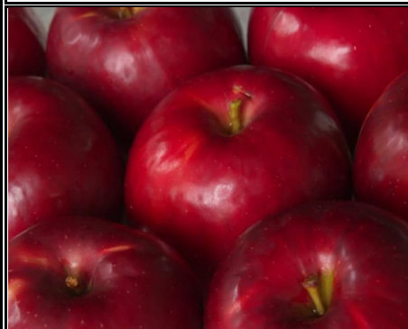
紅玉 長野 他