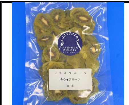
八百屋が作った素材そのままドライフルーツ キウイ