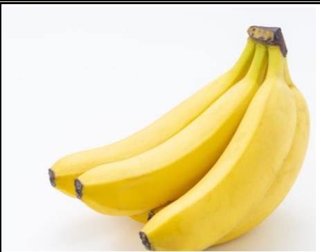
金の房バナナ フィリピン