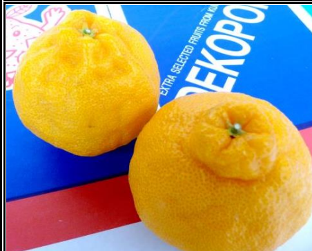
デコポン 熊本 他