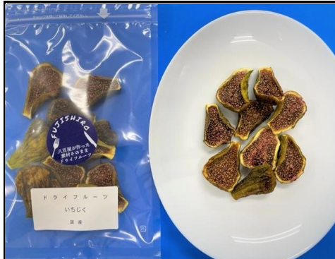
八百屋が作った素材そのままドライフルーツ イチジク