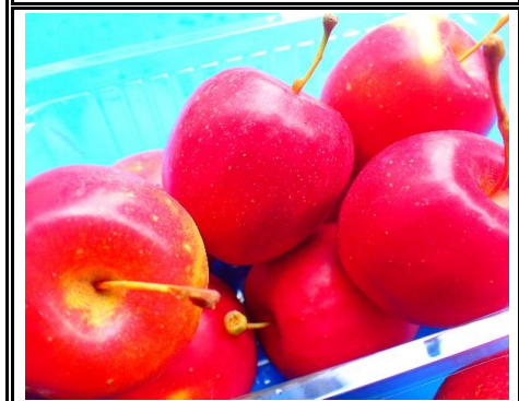
姫リンゴ 長野 他