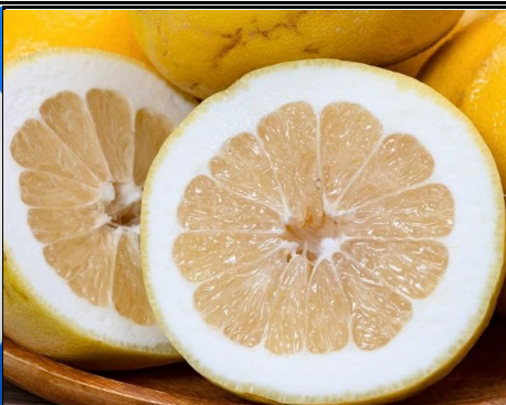
オロブロンコ アメリカ