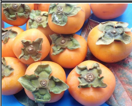
種あり柿 奈良 他