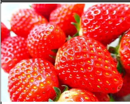
国産苺 栃木 他