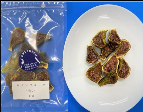
八百屋が作った素材そのままドライフルーツ イチジク