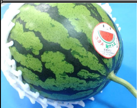
アンテナすいか 高知