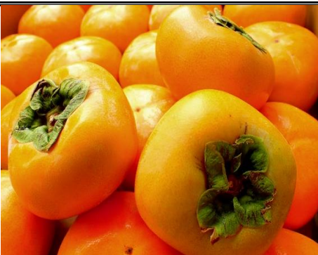
柿 奈良 他