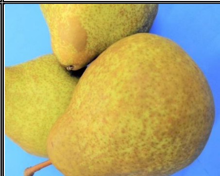
洋梨 山形 他