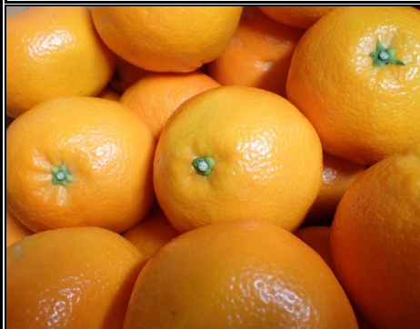
みかん 愛媛 和歌山 他