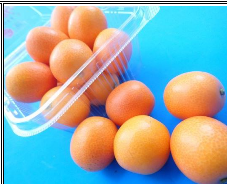
金柑 愛知 他