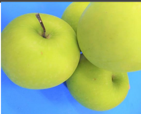
グラニースミス 長野 他