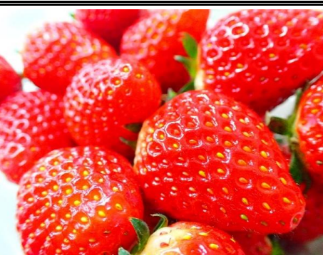
国産苺 栃木 他