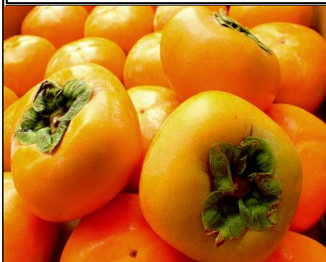
柿 新潟 他