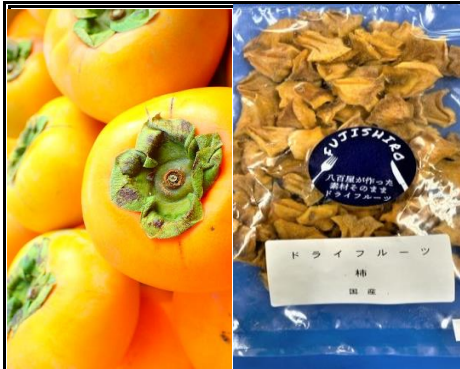
八百屋が作った素材そのままドライフルーツ 柿