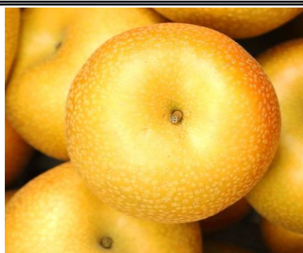
梨 埼玉 他