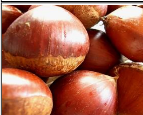
栗 茨城 他