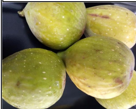
いちじく 愛知 他