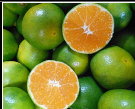
早生みかん 愛媛 他