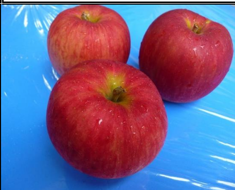
新りんご 長野 他