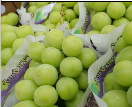
シャイン マスカット 長野 他