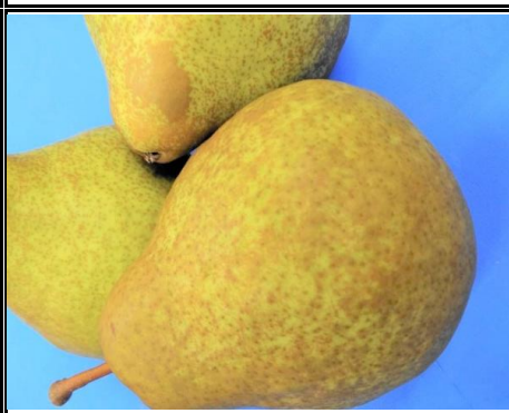
洋梨 山形 他