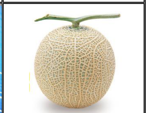
横浜産メロン 神奈川