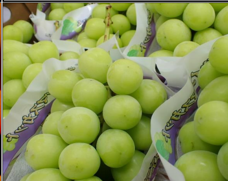
シャインマスカット 山梨 他