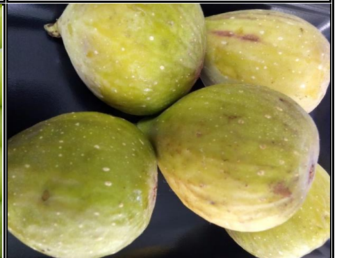
いちじく 神奈川 他