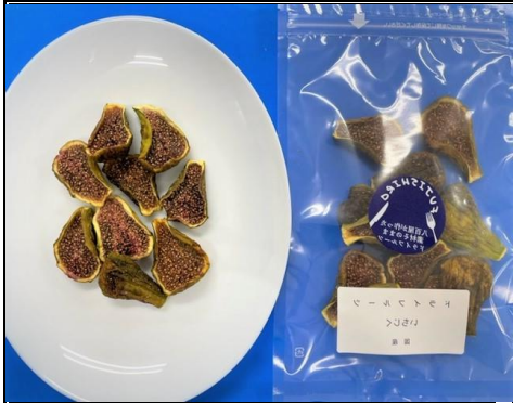
八百屋が作った素材そのままドライフルーツ イチジク