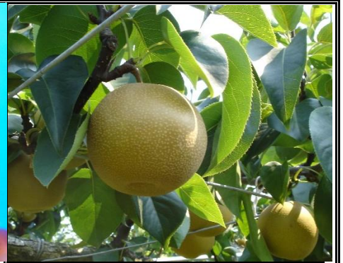
横浜産なし 神奈川