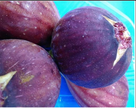
いちじく 愛知 他