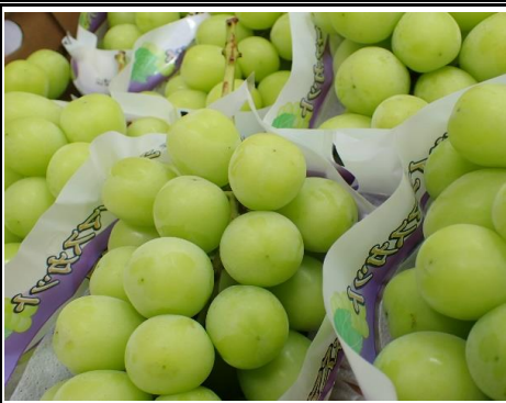
シャインマスカット 山梨 他