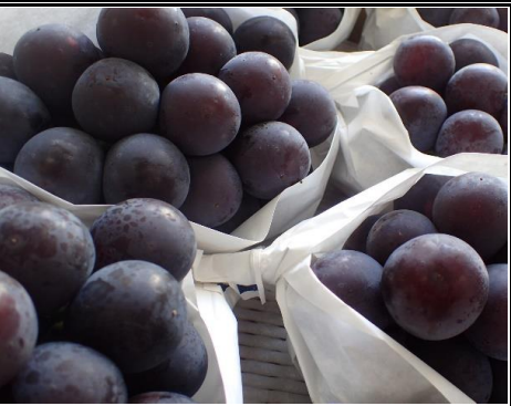
巨峰ピオーネ 山梨 他