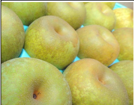
梨 埼玉 他