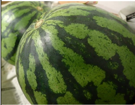
すいか 山形 他