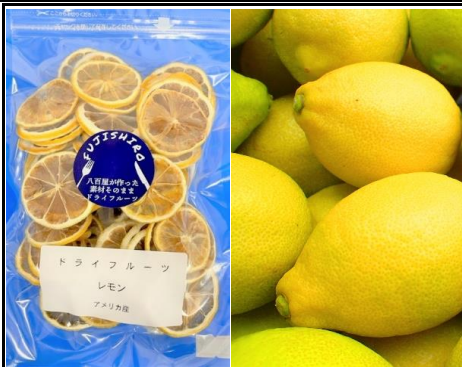
八百屋が作った素材そのままドライフルーツ レモン