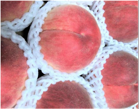
もも 福島 他