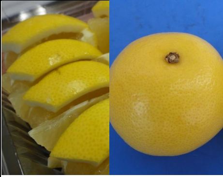
ジャクソンフルーツ 南アフリカ