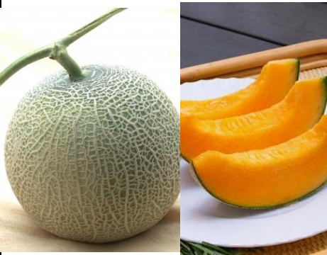
富良野産メロン 北海道