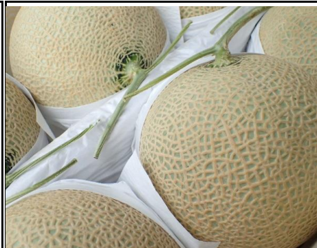
国産メロン 静岡 他