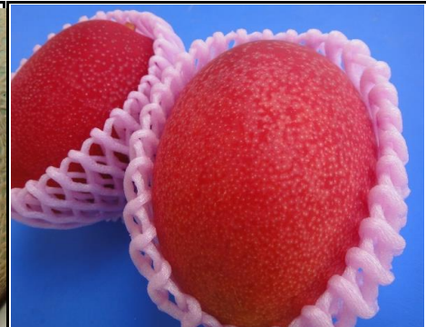
国産マンゴー 宮崎 他