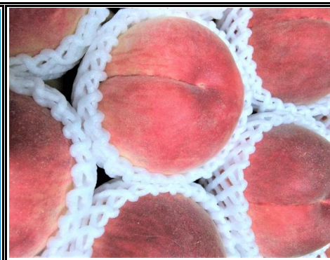
もも 山梨 他