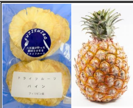
八百屋が作った素材そのままドライフルーツ パイン フィリピン産