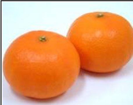
マーコットオレンジ オーストラリア