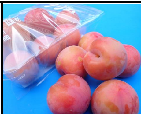
プラム 山梨 他