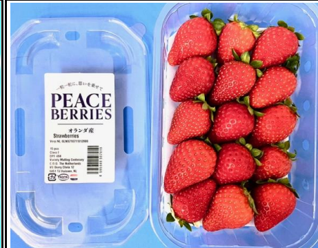
オランダ産いちご オランダ