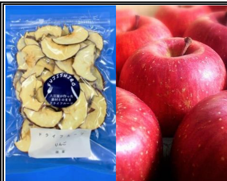
八百屋が作った素材そのままドライフルーツ りんご