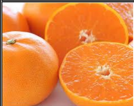
せとか 愛媛 他