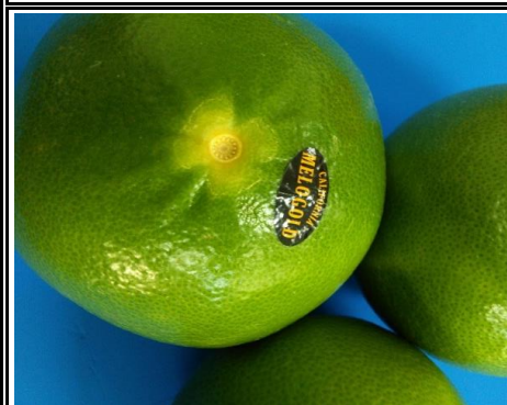
メロゴールド アメリカ