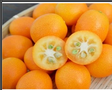
きんかん 宮崎 他