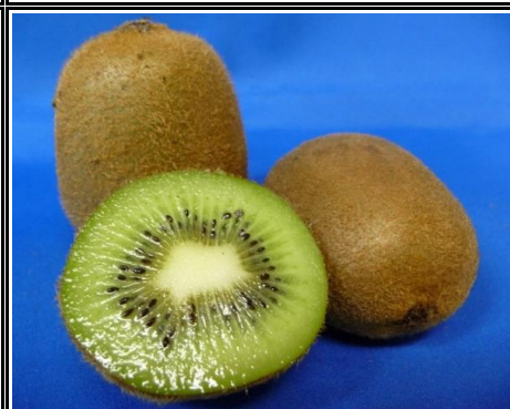
国産キウイ 愛媛 他