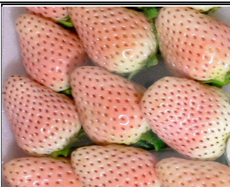
淡雪 (白いちご) 兵庫、茨城 他