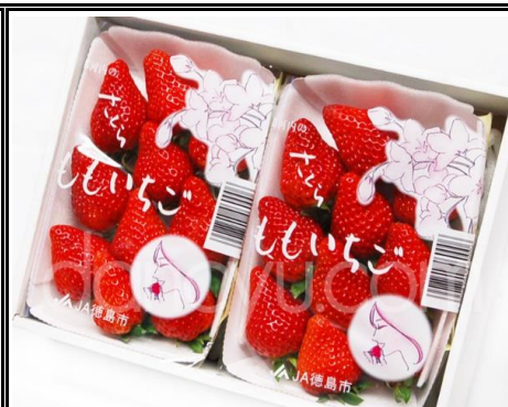
さくらもも苺 徳島