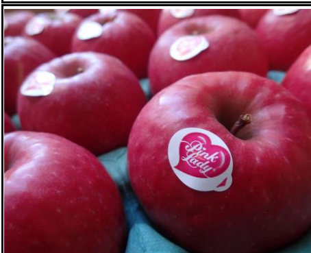
ピンクレディ 長野