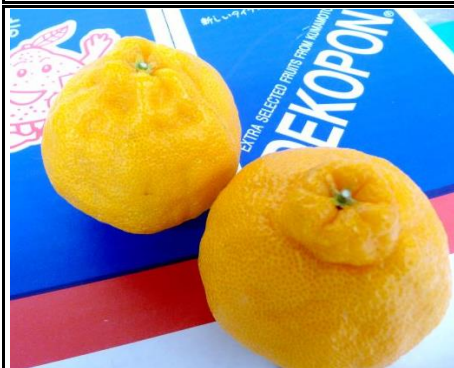
デコポン 熊本 他