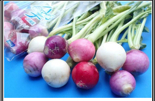
市内産カラフルラレシ 神奈川