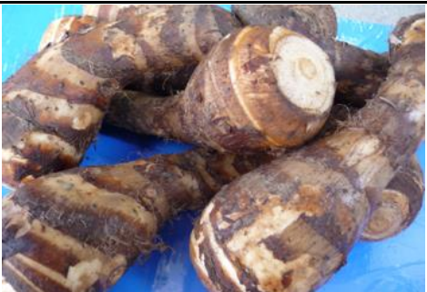
海老芋 静岡 他