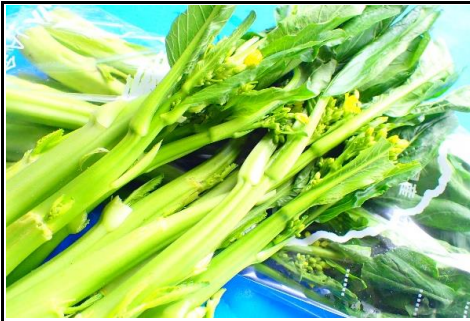
オータムホエム (アスパラ菜) 新潟 他