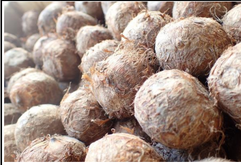
石川芋 静岡 他