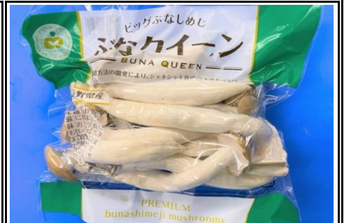
ぶなクイーン 長野