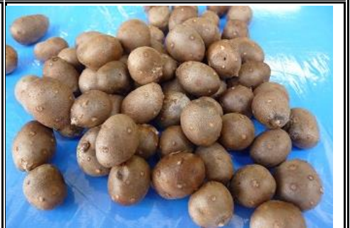
むかご 茨城 他