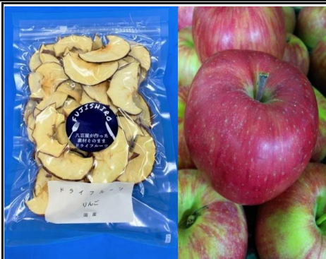
八百屋が作った素材そのままドライフルーツ りんご