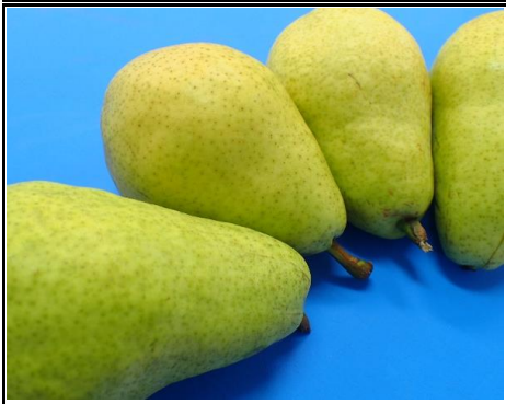
洋梨 山形 他