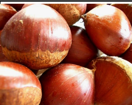
栗 茨城 他