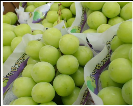
シャインマスカット 長野、岡山