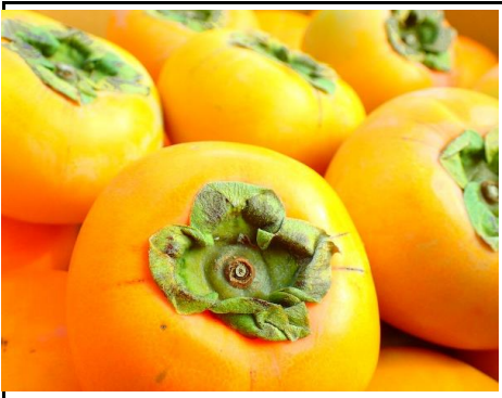
柿 新潟 他