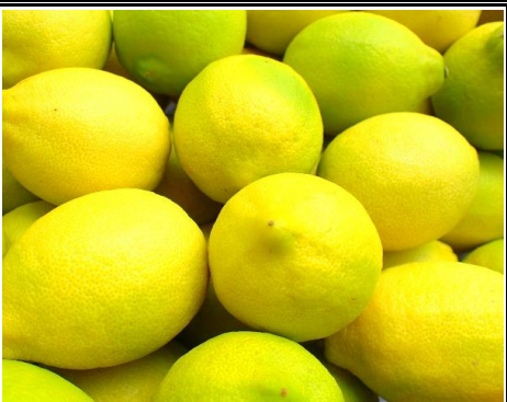
国産レモン 広島 他