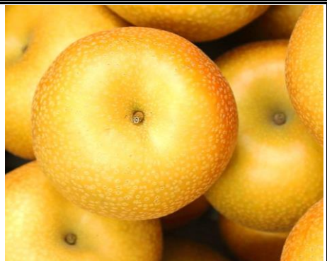
梨 埼玉 他