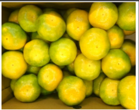
みかん 愛媛 他