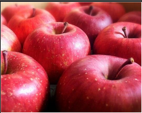
新りんご 長野 他