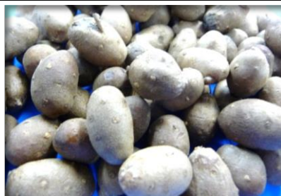
むかご 茨城 他