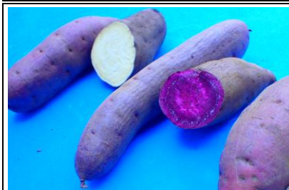
紫芋 千葉 他