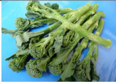
スティックセニョール 北海道 他