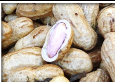
落花生 神奈川 他