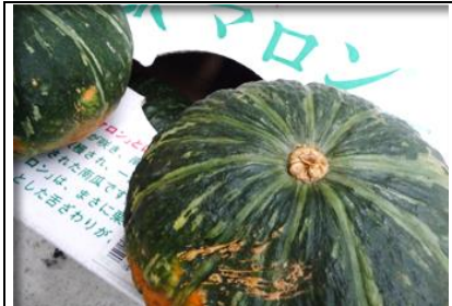
栗マロン南瓜 北海道