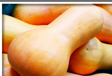
バターナッツスクワッシュ 神奈川 他