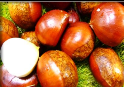
生栗 熊本 茨城 他