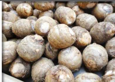
石川いも 静岡 他