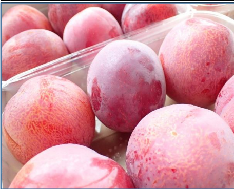
プラム 福岡 他 さわやかな甘酸っぱさが魅力です