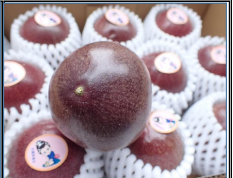
パッションフルーツ 沖縄・鹿児島 他 トロピカルな味わいを是非

※ アイテムにより当日の大量受注、入荷量等により品薄、売り切れになりご注文数を納品できない場合がございます。