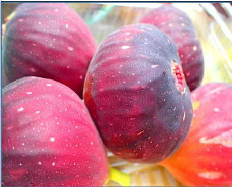
いちぢく 愛知 他 芳醇な香りとプチプチ食感が絶品