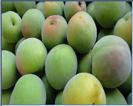
南高梅・青梅 和歌山・神奈川 他 各産地スタートです