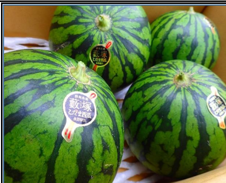
小玉スイカ 千葉・茨城 他 夏の香りが深いです