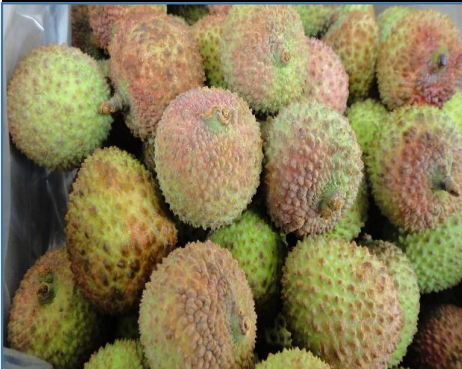
ライチ 台湾 期間限定 たっぶりの甘味を楽しめます