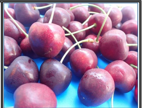
USAチェリー USA 順調に入荷中 甘み、酸味、濃厚な味わい