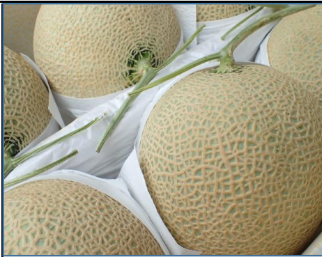
メロン各種 静岡・茨城 他 きめ細やかで滑らかな食感 香りも十分！