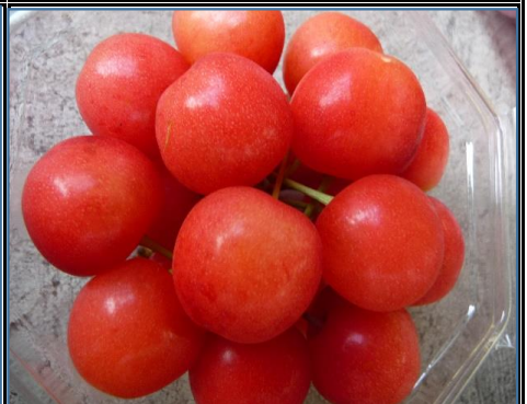
さくらんぼ 山形 他 いよいよ旬の到来です